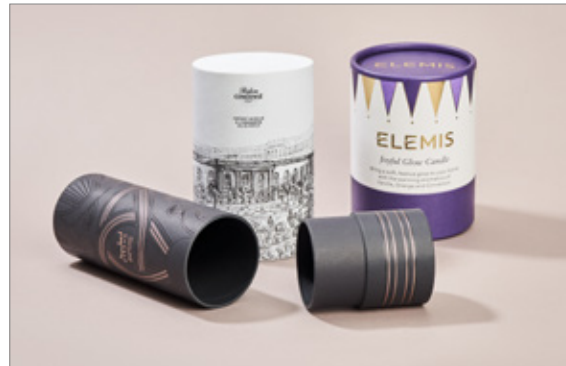
Boîtes en carton