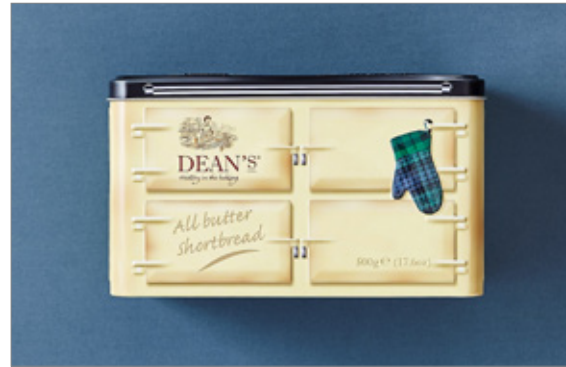
Pourquoi des boîtes métalliques ?