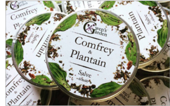
Boîtes en Aluminium