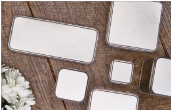
Boîtes en fer blanc