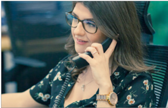
À propos de nous